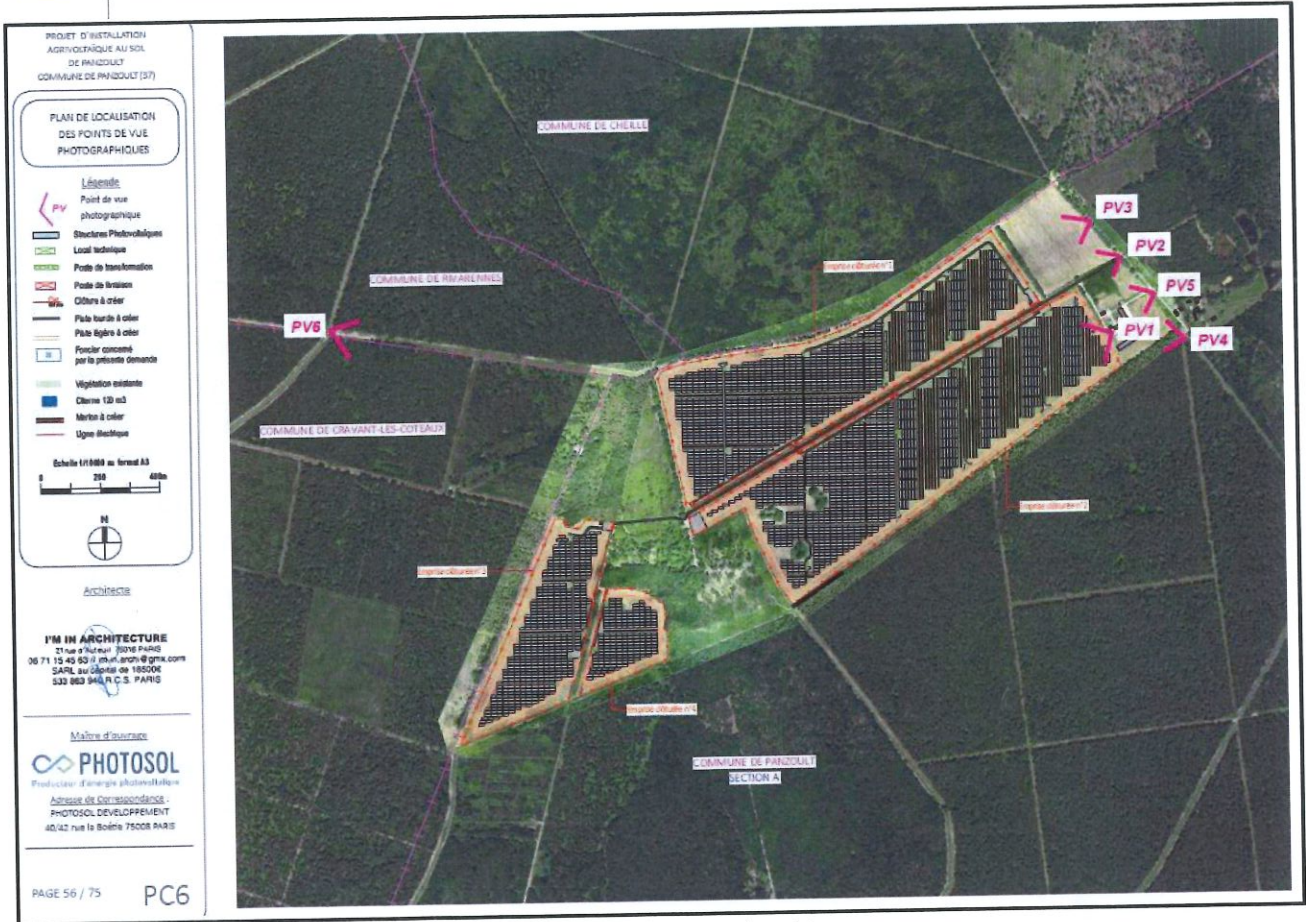
Illustration 2 : plan masse du projet